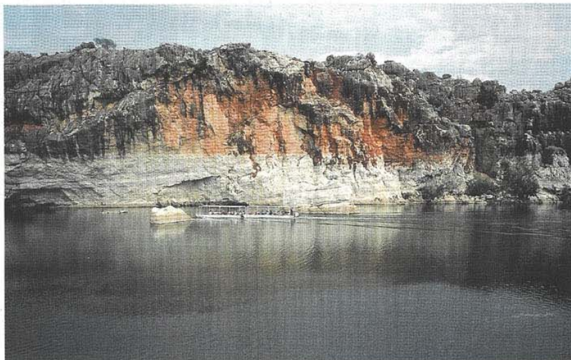
Die Geschichte der Aborigines als Tourismusattraktion: Die Schlucht Geike Gorge erzählt vom mythischen Ursprung.

Schweizer reisen immer häufiger nach Australien, um die Kultur der Aborigines kennen zu lernen. Die Ureinwohner hoffen, durch den Tourismus aus der sozialen Misere herauszukommen.