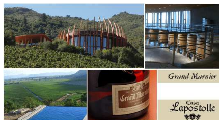
Casa Lapostolle, the family-owned producer of premium Chilean wine, celebrates the opening of its striking state-of-the-art grand-vineyard Winery & Lapostolle Residence, dedicated solely to the production of its flagship wine Clos Apalta